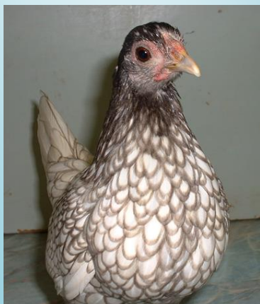
Poulette argenté liseré bleu