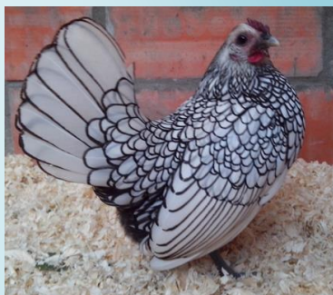
Poule argenté liseré noir