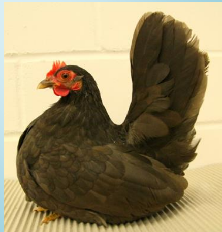
Poule Chabo chocolat à Leipzig en 2012

Voici le standard EE : Pour les deux sexes, un brun foncé uniforme, particulièrement brillant chez le coq. Camail des deux sexes coloré un plus intensivement que le reste du plumage. Les rémiges primaires sont un peu plus claires que le plumage du manteau. Sous-plumage d'un brun un peu plus clair. Iris de couleur brune, tarsi couleur chair, avec traces brunâtres, plus foncés chez la poule. Défauts graves: couleur de fond trop claire ou tachetée, manque de lustre, tige des plumes éclaircies, sous-plumage gris, suie, dépigmentation.