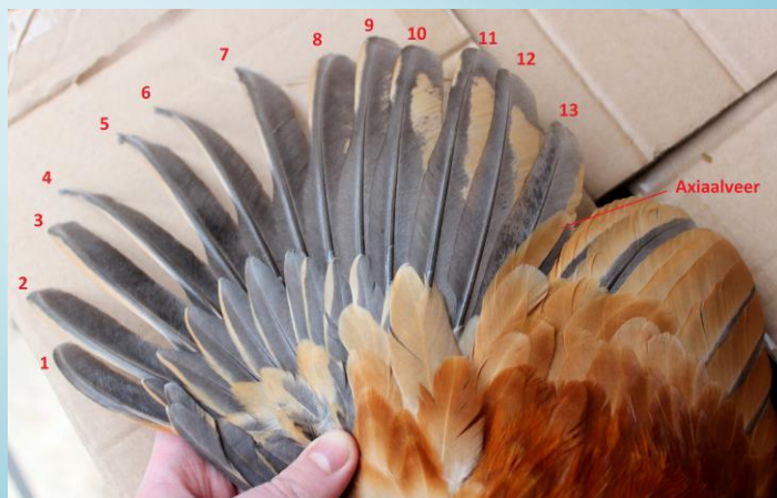
Ce coq Brahma nain fauve herminé bleu, de Belgique, possède visiblement trop de rémiges primaires.

Avant de prendre une décision sur la façon d'aborder ce problème, (punir ou pas, et si oui, comment), la CES-V aimerait savoir dans quelle mesure ce phénomène existe dans d'autres pays. Pour cette raison, il a été décidé de contrôler cette affaire au niveau européen, afin d'obtenir une meilleure vue d'ensemble de cet anomalie. Les commissions nationales du standard sont invitées à collaborer à ce contrôle. Après réception des informations des pays, la CES-V se prononcera sur la suite de la procédure.